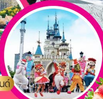
ลือตเตเวิลด์