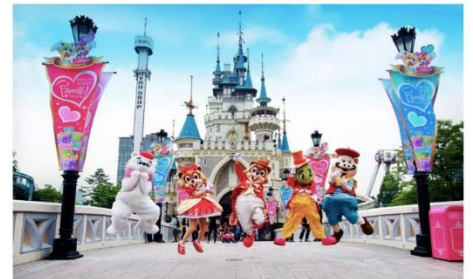
ลือตเต็วิลด์