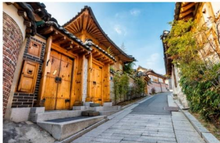
หมู่บ้านโบราณบุกซอน