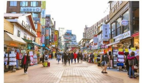
ย่านฮงแด