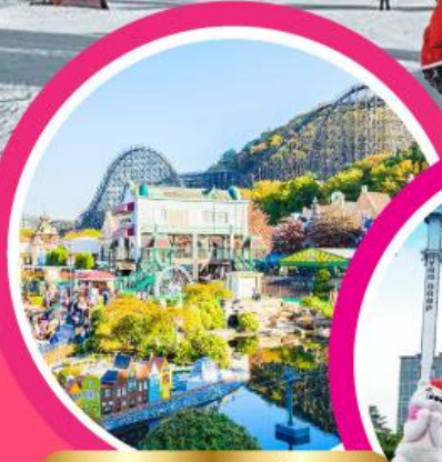
สวนสนุกเอเวอร์แลนด์