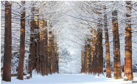
เกาะนามิ