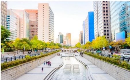
คลองชองเกซอน